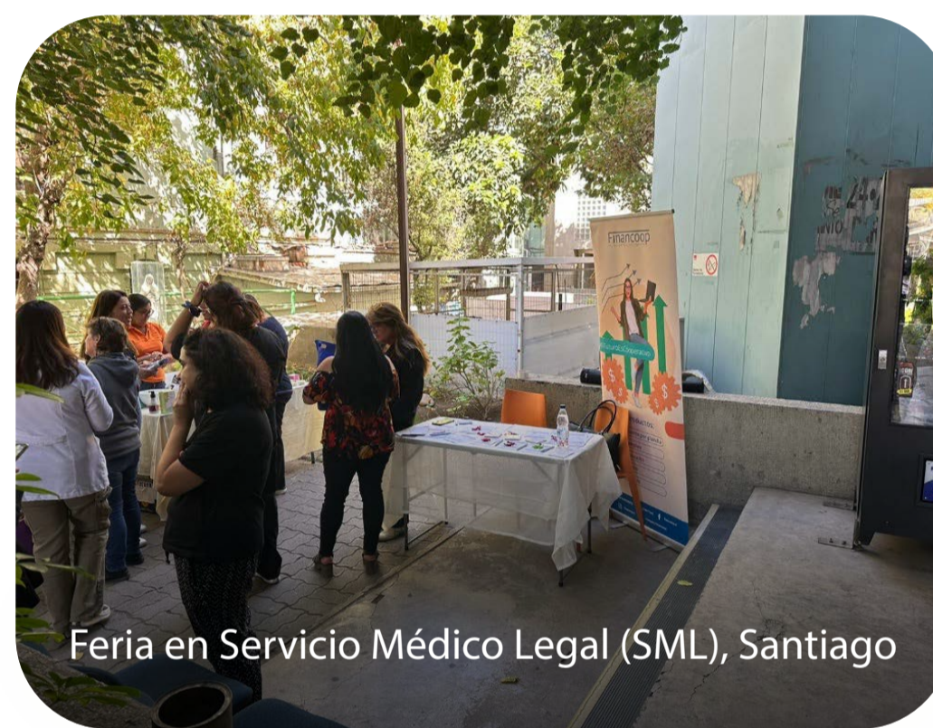
Feria en Servicio Médico Legal (SML), Santiago